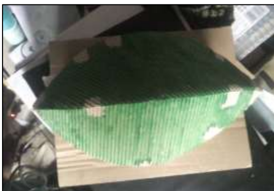
Vista de cima da WC publica, conceito de uma folha

Por ultimo teríamos no pátio a lavandaria e outras coisas que poderia ser implementadas.