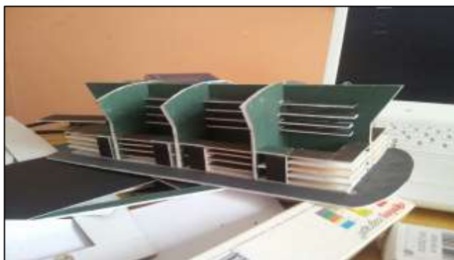
Quiosque, partindo de um pipino