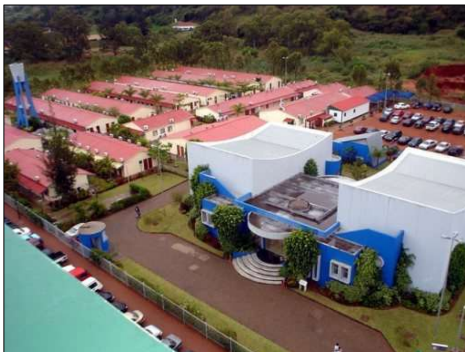
Foto areia do ISCTEM