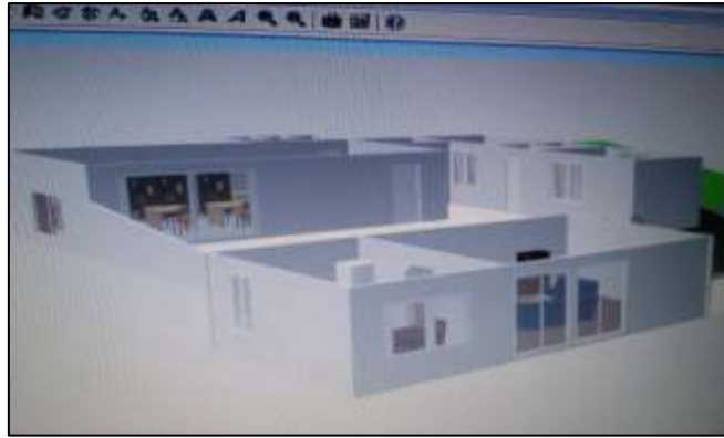
Casa de estudantes. Foto do projeto num computer.